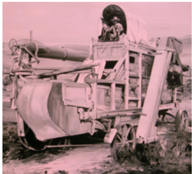
Paco Pomet: Colonos

feblesa de la utopia d'una societat justa basada en l'educació de la població) com del sistema soviètic el 1989, ara el sentit de la utopia es desplaça de l'ordre social a l'ordre extra social. I més particularment a l'ordre mèdic: tenim el sentiment que ja només el perfeccionament tecnocientífic pot posar límits als sentiments de desorientació i declivi de l'home i el món. 7 El transhumanisme obre, així, les portes a la concepció d'una utopia basada en la capacitat de transformar l'home en quelcom superior del que es dóna en la naturalesa.