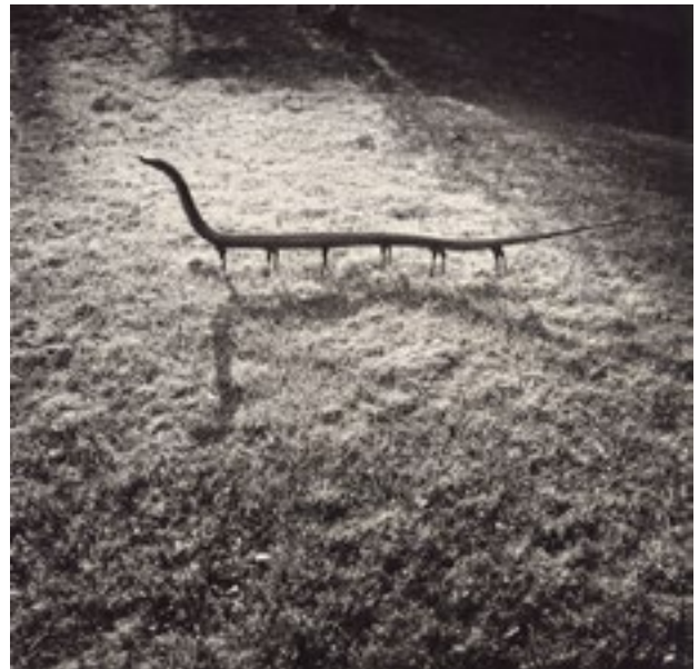
Joan Fontcuberta, Sèrie Fauna