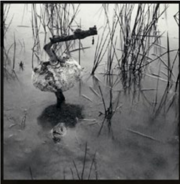
Joan Fontcuberta, Série Fauna