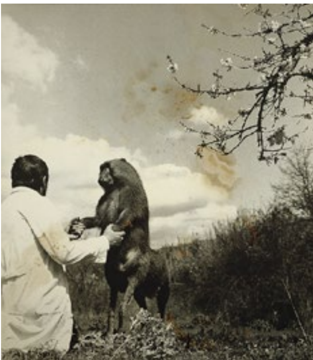
Joan Fontcuberta, Sèrie Fauna