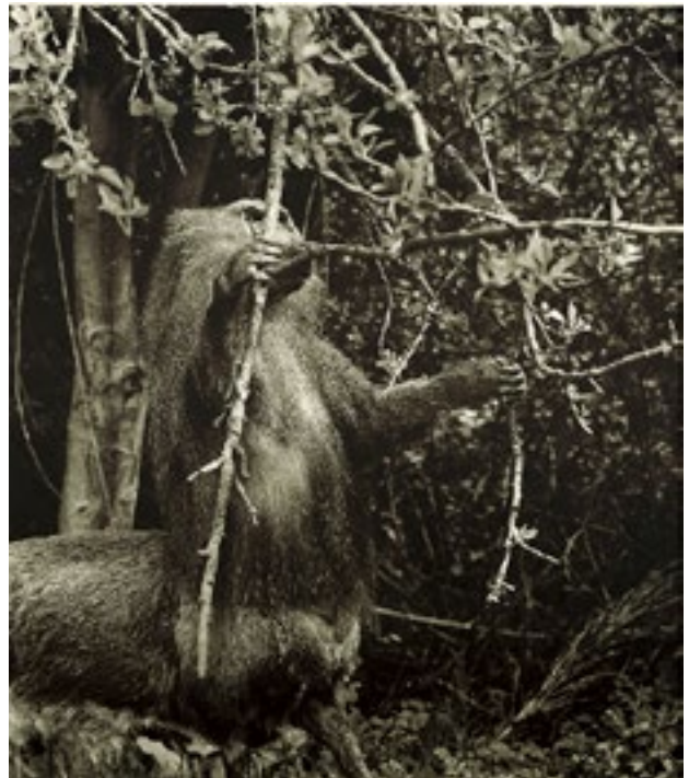
Joan Fontcuberta, Sèrie Fauna

sa: tenim coneixements indubtables i també d'insegurs, però mai no arribem a un desconeixement o ignorància total; desitgem, doncs, que la realitat no sigui negra, fosca, incògnita. I és normal també, si no natural, que, en la nostra grisa realitat, tinguem la pretensió i el desig d'assolir un coneixement cert que ens permeti contemplar una realitat clara i blanca, tot i ser conscients que aquesta realitat és ideal i pertany a una altra esfera que, per les seves propietats i característiques, qualifiquem d'autèntica o vertadera, i que, malgrat que ens costi, ens duu a qualificar-ne la borrosa d'inautèntica pel fet de ser diferent.