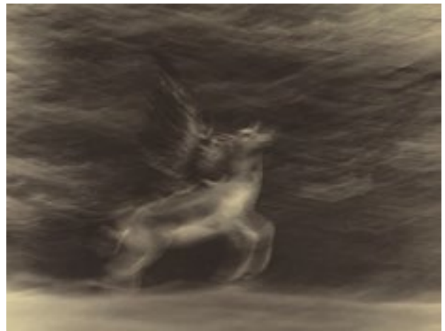
Joan Fontcuberta, Sèrie Fauna